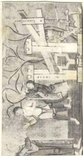
Devastazioni della guerra: case distrutte, campi devastati, raccolti rovinati. La guerra che è motivo di gloria e spesso fonte di guadagno per i feudatari grandi e piccoli, significa desolazione e miseria per l'umile gente delle campagne.

Come altri feudatari alcuni Pannocchieschi furono guelfi ed altri ghibellini tra i quali ultimi vanno ricordati i conti d'Elci.