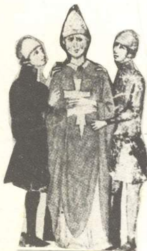
L'arresto di Bonifacio VIII